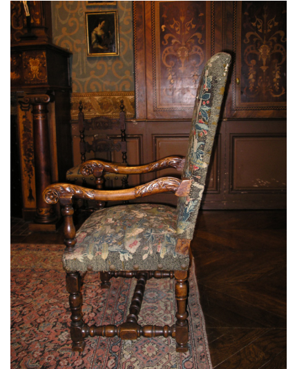
Fauteuil Louis XIII Musée Charles-Friry

Enfin, la garniture des chaises et fauteuil fait son apparition. Elle est recouverte de cuir gaufré, de tapisserie ou de tissus. Des clous bombés fixent le tout et sont visibles sur tout le pourtour des sièges.