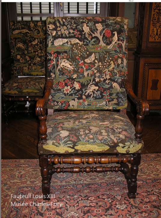
Fauteuil Louis XIII Musée Charles-Friry